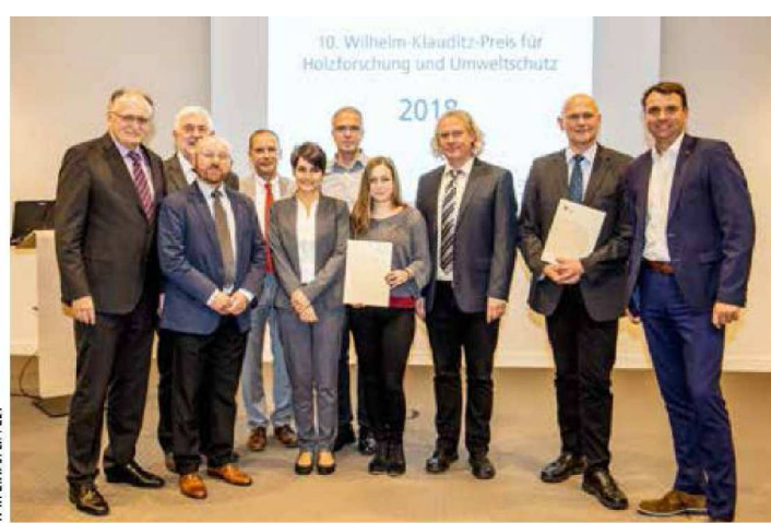
IVTH EV./S. LIPPELT